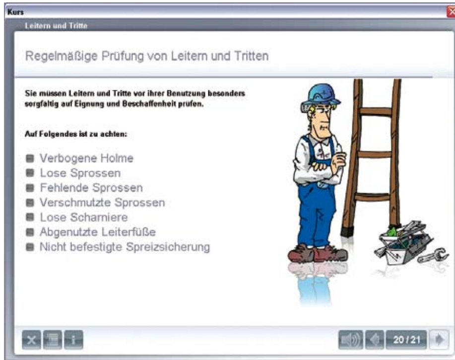
Bild 1: ZEUS-Layout am Beispiel des Lernmoduls „Leitern und Tritte“

Zeitersparnis von bis zu 75 % gegenüber klassischen Präsenzs Schulungen bei einer Teilnehmerquote von 98 bis 100 % erreicht.