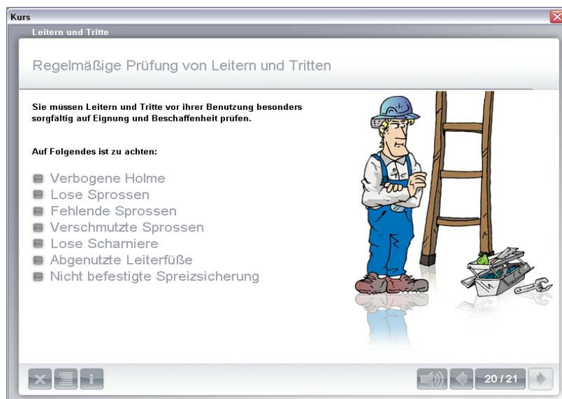
ZEUS-Layout am Beispiel des Lernmoduls „Leitern und Tritte“

Elektronische Unterweisungen mit ZEUS bieten die Möglichkeit, Schulungen kostengünstig und zeitsparend durchzuführen. Mit dieser Methode kann ein großer Teil der bisher erforderlichen Präsenzs Schulungen wirksam ersetzt werden. Durch die zeitliche und örtliche Flexibilität der elektronischen Unterweisung werden die Mitarbeiter in jedem Fall erreicht. Somit entfallen die üblicherweise unvermeidbaren Wiederholungstermine für die Mitarbeiter.